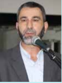
بقلم الشيخ حسام أبو ليل رئيس حزب الوفاء والإصلاح