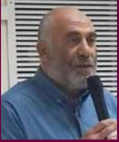
بقلم أ. يوسف كيال